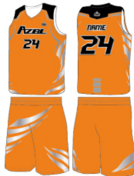
客製化範例款(橙橘款)