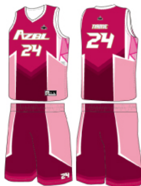
客製鉅劍款(綜合野莓)