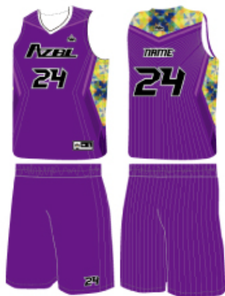
客製鉅劍款(水晶紫款)