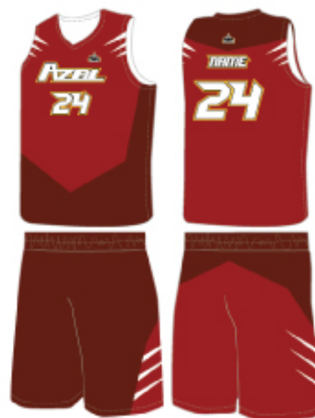
客製化款式(酒紅款)