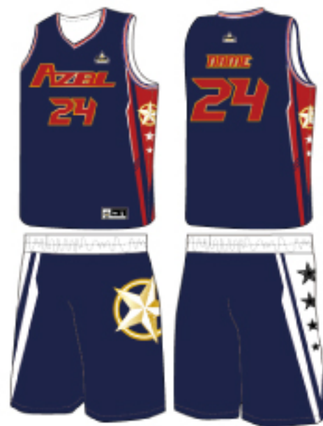
客製化藍色 (藍藍款)