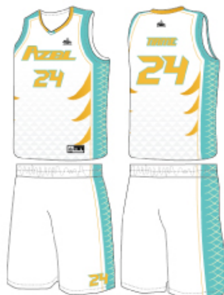
客製範例款(湖水綠款)