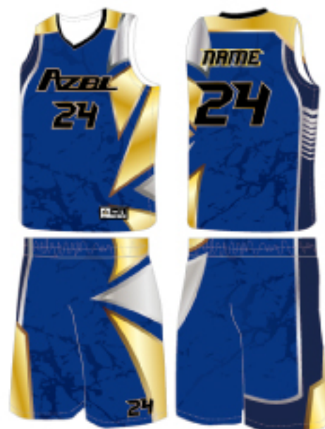
客製範例款(靛藍款)