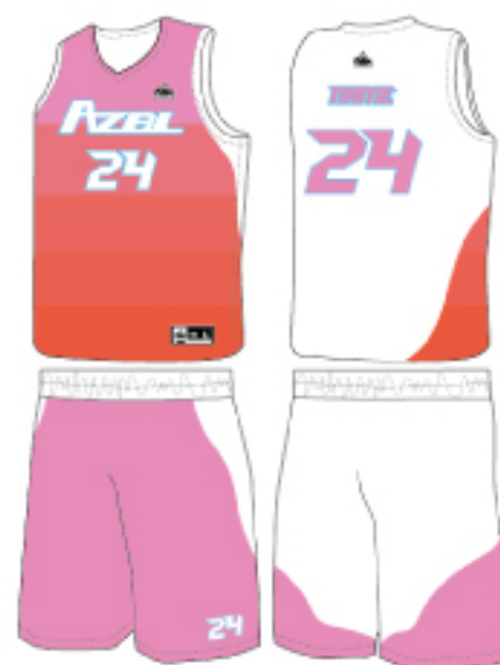
客製化倒款(粉橘款)